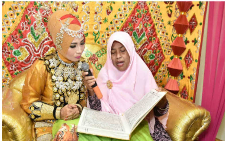
Gambar 1: Pengantin Perempuan didampingi saat mengkhatamkan Qur'an

Selain memaksa kaum perempuan keluar rumah untuk bersosialisasi, ritual mohatamu juga memaksa kaum perempuan mempersiapkan mental untuk tampil di depan publik. Sebagaimana dikemukakan para informan bahwa sejak anak gadis mereka dilamar seseorang, sejak saat itulah anak gadisnya secara rutin melakukan latihan, membaca al-Qur'an dengan baik dan benar, baik di hadapan orangtuanya maupun dilakukan secara mandiri di depan cermin. Dengan melakukan latihan secara rutin, rasa malu dan tidak percaya diri berangsur-angsur pulih.