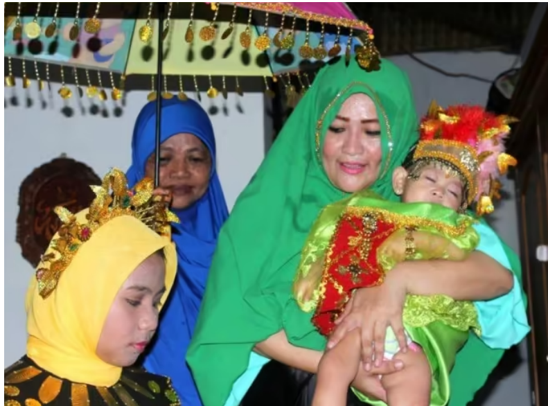
Gambar 3. Anak Perempuan Usai Sunatan

Gambar 3 menunjukkan seorang ibu menggendong anak perempuannya yang telah tertidur pasca prosesi pembersihan (sunatan). Ritual adat ini dilaksanakan berdasarkan keyakinan masyarakat bahwa perempuan yang tanpa disunat tidak bisa mengontrol libido. Ketika dewasa, dia akan dipersepsikan tidak dapat menjaga kehormatan diri dan keluarganya. Pandangan lain menyebut tradisi molubingo berkelindan dengan keutamaan thaharah (bersuci) dalam Islam. Molubingo dipahami sebagai pembersihan bagian kelamin anak perempuan yang di dalamnya terdapat seremoni penyucian seperti siraman air jeruk purut. Argumentasi ini menunjukkan bahwa praktik molubingo adalah sebuah tradisi yang kuat, berdiri di atas teks keagamaan dan nilai keluhuran kebudayaan lokal. 35 Praktik ini dianggap sakral dan wajib dilaksanakan anak perempuan Gorontalo yang beragama Islam dan menjadi bukti keislamannya.