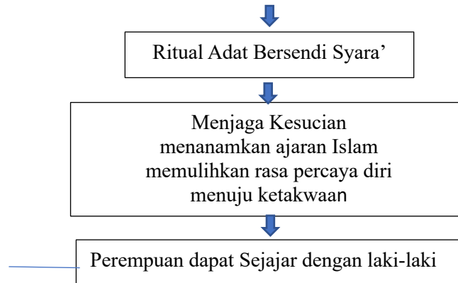
Diagram 1: Jejak Kesetaraan Gender