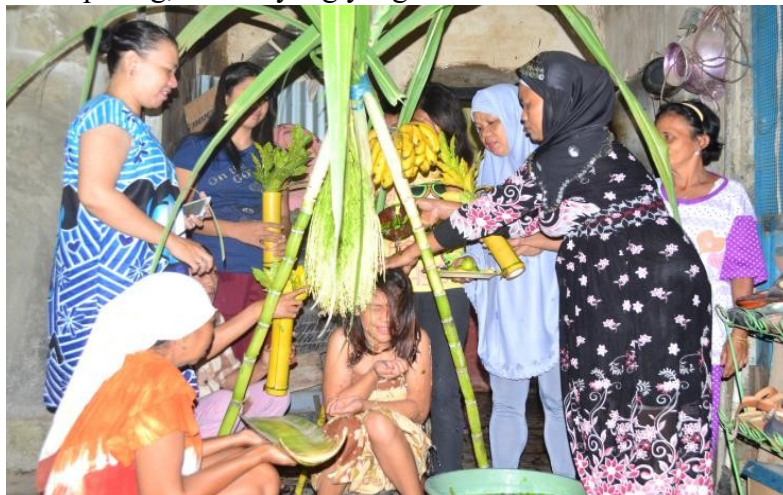
Gambar 2: Tahapan Mandi Lemon sebelum Mome'ati

Sebelum ritual mohatamu , kaum perempuan telah diikrar untuk menjalankan syari'at Islam melalui ritual mome'ati . Mome'ati (baiat) adalah ritual yang dilaksanakan saat anak gadis beranjak remaja, ritual dilaksanakan setelah siklus haid berhenti. Pada saat itu anak perempuan akan dimandikan dengan jeruk purut dan kembang (mandi lemon). Si gadis duduk di atas alat parutan kelapa yang dihiasi dengan batang tebu, setandan pisang, dan mayang yang terurai.